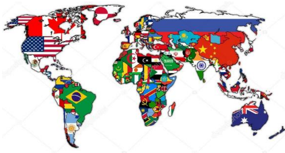
Політична карта світу

Політична карта світу — це географічна карта, на якій зображено всі країни, їх кордони і столиці.